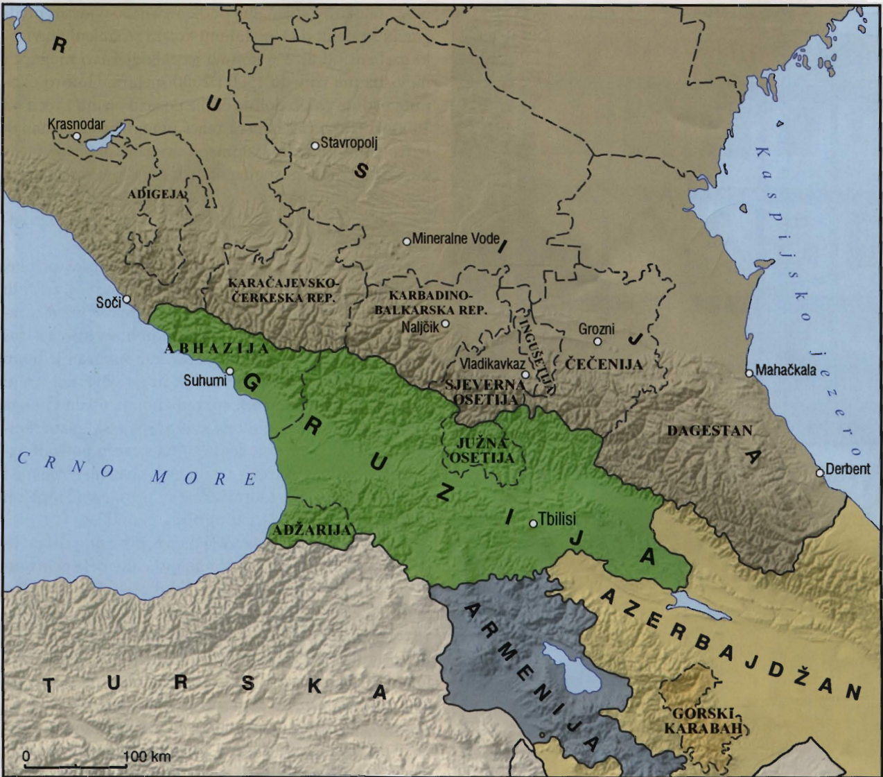
Pregledni zemljovid kavkaskog područja (izradio Tomislav Kaniški)

Krasnodarski i Stavropoljski kraj kao i etničke (»neruske«) republike Adigejsku, Karačajevsko-Čerkesku, Karbaidno-Balkarsku, Čečeniju, Ingušetiju i Dagestan. U najnovije vrijeme u uporabi je, posebice u okviru statistike, nešto šira teritorijalna definicija prema kojoj se područje »Ruskoga Juga« naziva Južnim saveznim distriktom (ustanovljen u svibnju 2000. u okviru nove političke podjele). Osim navedenih jedinica Južni savezni distrikt je obuhvatio još i Volgogradsku i Astrahansku oblast te Kalmičku republiku.