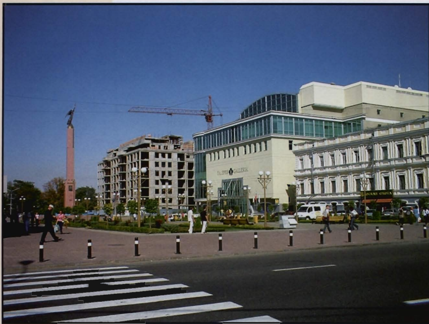
Stavropolj, jedno od gradskih središta u predplaninskom dijelu Sjevernog Kavkaza