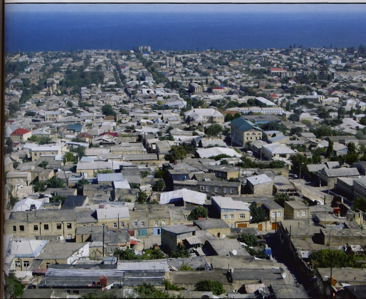
Derbent, grad u Dagestanu, najstarije gradsko naselje u području. Derbentska utvrda na popisu je Svjetske baštine UNESCO-a

ere povezano- a. Nakon osa- ni status Južne šnjom gruzijs- ičkih republi- u i svojom na- no-gospodar- ojačale nacio-