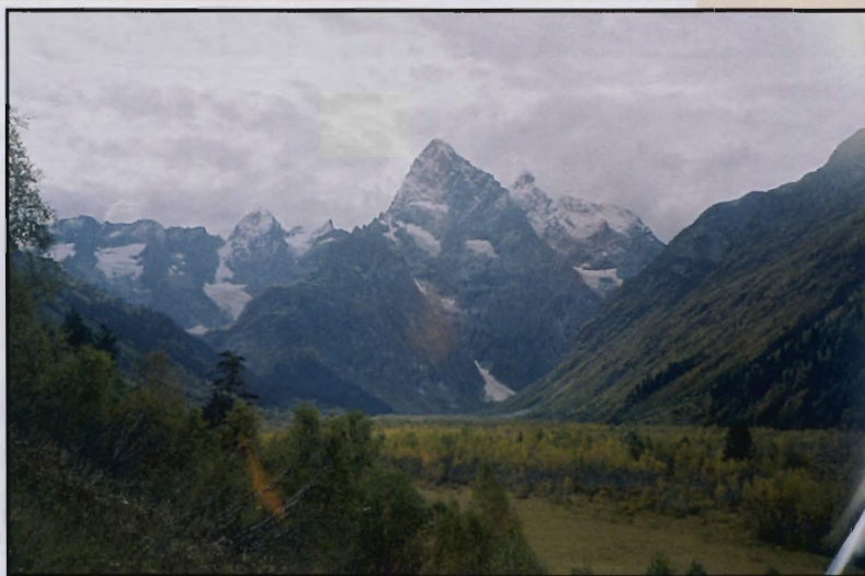
Dolina rijeke Gonačhir u ruskom dijelu Kavkaza. Dolinom prolazi tzv. vojna gruzijska cesta građena u 19. st. koja vodi za Abhaziju i jedna od rijetkih prekokavkaskih cestovnih veza (zatvorena od 1991).

Važan je gospodarski čimbenik integracije sjevernokavkaskog područja turistički potencijal, no sve dok ga se doživljava kao nesigurno pa i opasno zbog oružanoga sukoba i terorizma, turistički će promet bi-