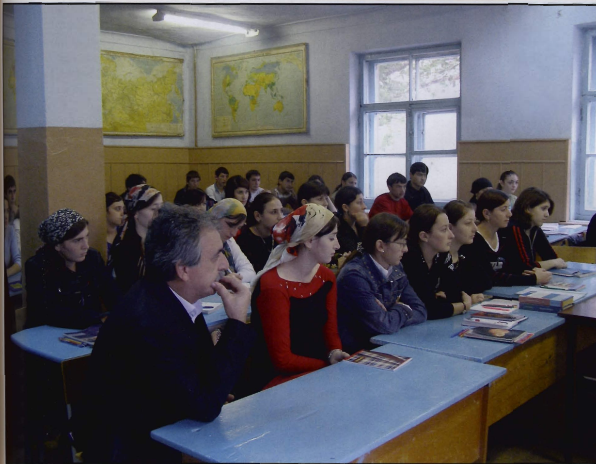
Studenti sveučilišta u Mahačkali

lacijski gubitak uzrokovan smrtnošću. Istodobno došlo je i do promjene glavnoga poticajnog čimbenika migracija jer su gospodarski razlozi došli u prvi plan umjesto političkih. Do sredine tekućeg desetljeća depopulacija je zahvatila 10 od 13 regija Južnoga saveznog distrikt. Nakon 2000. broj stanovnika povećan je jedino u Dagestanu i Ingušetiji te u Čečeniji, za koju je, međutim, valjanost podataka upitna.