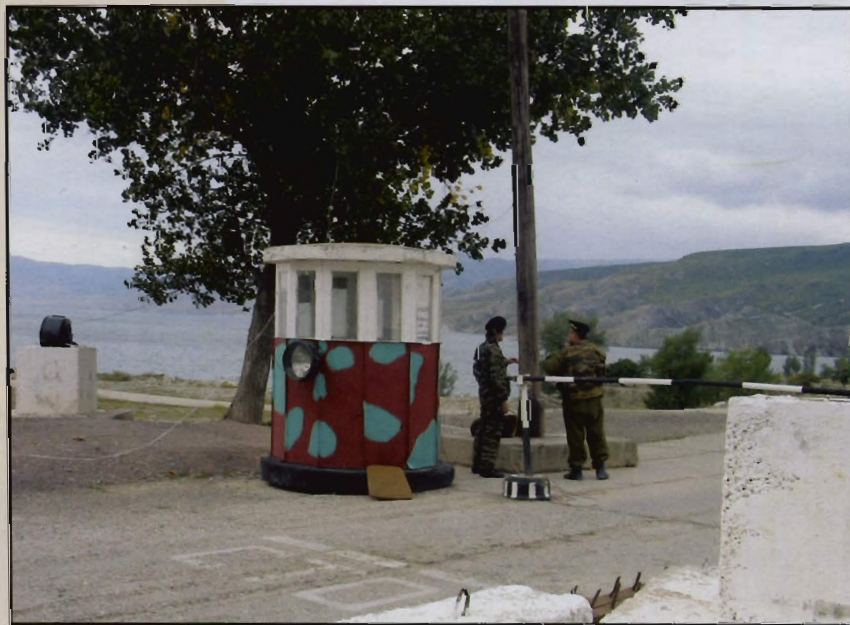
Potjernica (Traži ih policija...) s imenima i slikama osuđjenih za terorizam u Mchahačkai