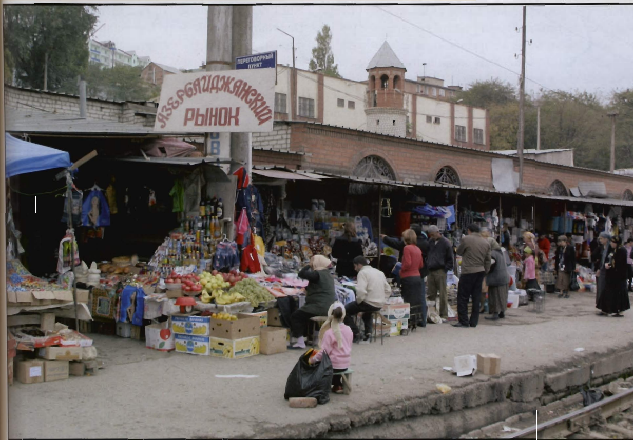
Azerbajdžanska tržnica u Mahačkali, glavnom gradu Dagestana

mirovnom konferencijom. Promicao ju je Narodni komesarijat za nacionalna pitanja (tzv. Narkomnac ), koji se zauzimao da se upravno-teritorijalna podjela što više uskladi s etničkim granicama. I sam Lenjin vjerovao je da nacije imaju vidljiva obilježja. U poznatom članku Pravo naroda na samoodređenje , razvijajući Marxove ideje, kao glavna obilježja nacije istaknuo je koncentraciju na nekom području, postojanje gospodarskih veza, zajednički jezik i zajednički mentalitet, odnosno kulturnu posebnost. S nekim stupnjem preciznosti sovjetski su geografi mogli iscrtati područje na kojem je neka skupina bila naseljena, mogli su izračunati broj govornika jezika te su mogli analizirati ekonomske veze i kulturne tragove. Te spoznaje bile su podloga namjere da se precizno teritorijalno razgraniče pojedine etničke skupine.