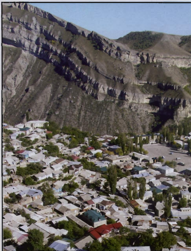
Gunjib, rajonsko središte u planinskom dijelu Dagestana

gestanskih te čečenskih sunita, mnogo otvorenijih aktivnoj penetraciji radikalnih islamističkih ideja i prakse.