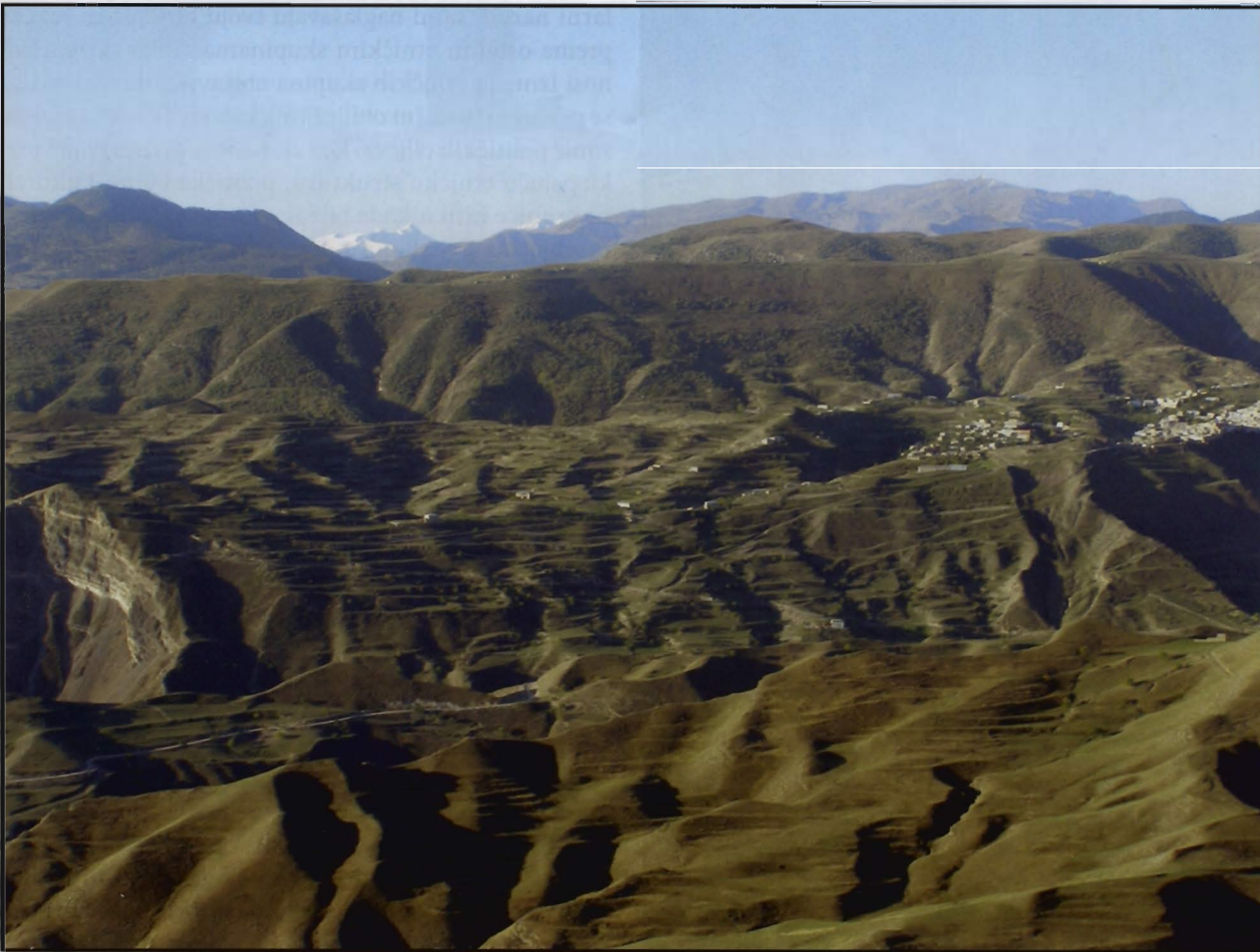
Kavkasko planine u središnjem dijelu Dagestana

jedino dugačkim cestama upitne kakvoće. Takav reljef razlog je gotovo posvemašnjem nepostojanju gradova u planinskom području.